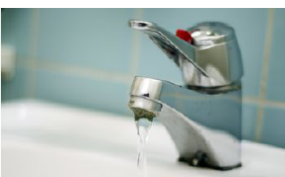
Vasaborna får betala mer för sitt vatten. Nya prishöjningar träder i kraft i oktober.